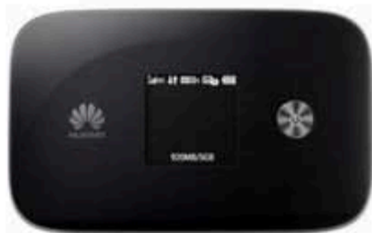
Hotspot mobile Huawei E5786 noir

La détox - surtout de printemps - est devenue un classique pour le bien-être du corps et de l'esprit. On fait le point avec 4 méthodes détox très différentes mais qui ont le même objectif. Ainsi, à chacun de choisir librement celle qui lui ressemble.