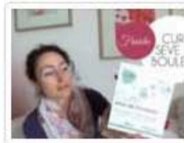
Je teste la cure de Sève de Bouleau fraîche