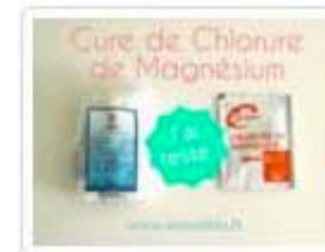
Cure Chlorure de Magnésium