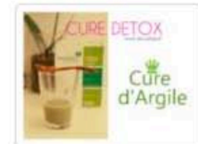
Cure Detox : Cure d'Argile