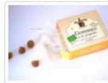
1 solution incroyable contre les remontées acides